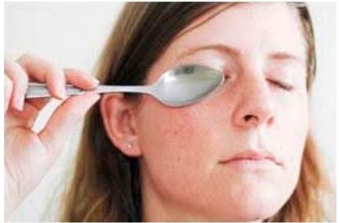
Imagen 2. Remedio casero contra las ojeras.

Es por ello que todavía no existen terapias de eficacia comprobada para evitar o tratar las ojeras (10) . El enfoque del manejo de las ojeras se reduce al enmascaramiento o minimización de los efectos que producen los factores provocadores (imagen 2) . Es decir, al cuidados ocular y facial mediante la aplicación de productos hidratantes, fotoprotección solar, camuflaje cosmético y una variedad de agentes aclaradores tópicos para reducir la hiperpigmentación postinflamatoria, siendo los remedios más utilizados para intentar disimularlas, pero no para curarlas.