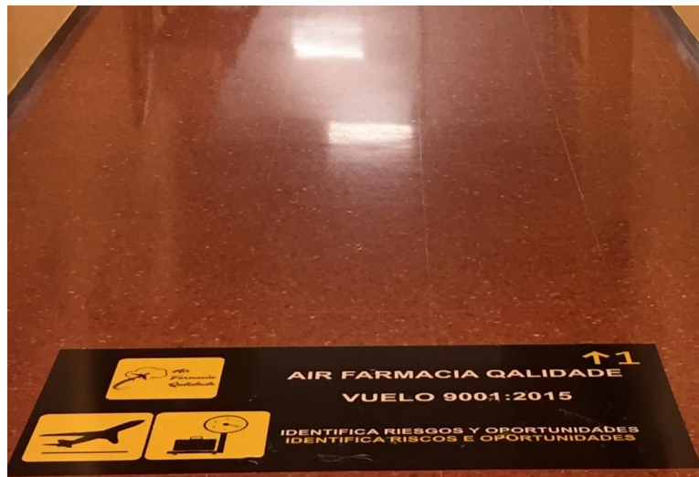
Imagen de Proyecto – Marca Diferencial Simbología Similar a la Aeroportuaria